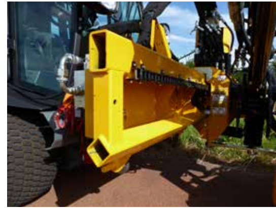
Duidelijk zicht tijdens transport