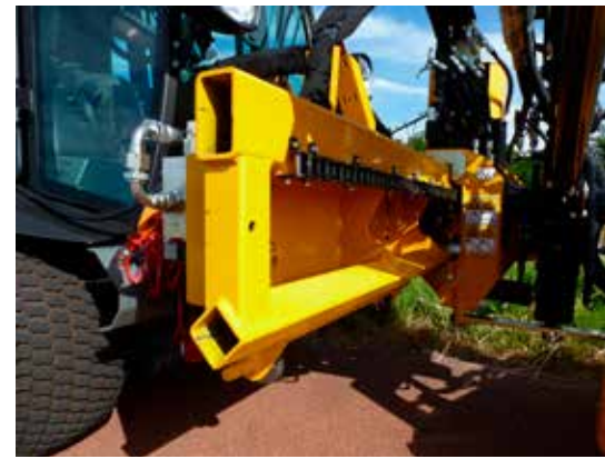
Freie Sicht während Transport